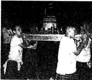
Levando ao Santo co traxe típico do día.

A troula non remata nunca antes das sete ou oito da mañá.