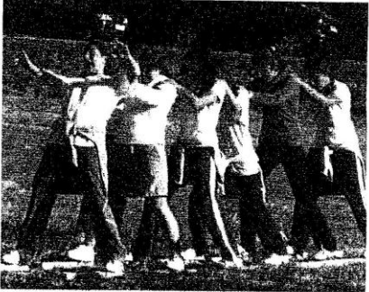
Olimpiadas parroquiais, na inaxe sky sobre troncos.