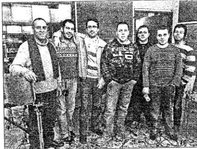
Os compoñentes de Berros do Castro no estudio de gravación Abrigueiro, en Friol

Este proxecto nace á raíz dun concurso de creación de espazos web para grupos emerxentes galegos, chamado Nsaio. Eles foron os pioneiros, os que serviron de proba para este espazo. O concurso celebrábase no auditorio do IES Rosalía de Castro, en Santiago. Tratábase