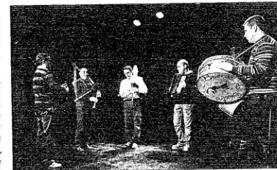
O grupo ao completo durante unha das súas actuacións

Moito material e moi diverso foi o que recolleron Berros do Castro. Fotos e partituras que