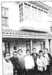
Mulleres participantes en rehabilitación para persoas maiores diante do edificio do local social.

A actividade "Tempo de mulleres" funcionou moi ben, van solicitar o módulo 2 á Dirección de