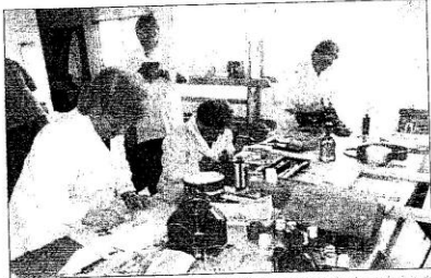
Mulleres participantes nas clases de manuaisidades realizadas dende o principio da asociación.

A Asociación Cultural, Recreativa e Deportiva San Loureiro de Santa Mariña do Monte creouse para dinamizar a parroquia e ter un local social como punto de encontro dos veciños e veciñas.