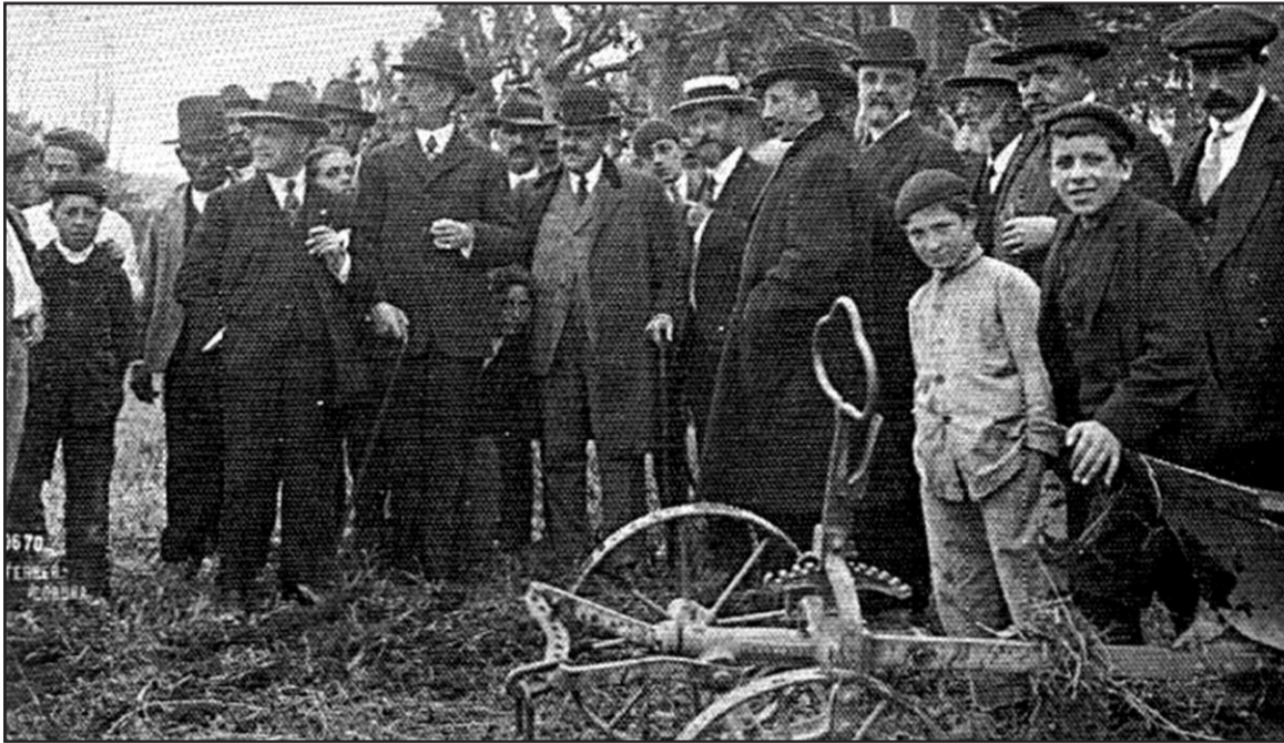
Mostra dun arado “brabant” na Granxa-Escola de Agricultura Regional de A Coruña.

Según a explicación existente no Museo da Ciencia de Londres, o arado de ferro utilizábase en Holanda hai máis de 300 anos. Paseniñamente introdúcese en Escocia e, ao redor do 1800, inventores ingleses fanlle melloras como dotalo de pezas cambiáveis. En 1825 consideran ultimado o modelo que se espallará por todo o mundo. O coñecido “atraso secular” da agricultura galega cúmprese con exactitude, pois só en 1926 o novo aparello chegará ás mans dos labregos asociados no concello de San Sadurniño... cando nos países industrializados xa eran comúns os tractores. Dende entón, e durante varias décadas, ferreiros do territorio fixeron o arado de “rabelas”. Moitos veciños, nados nos anos 30 e 40, acordan o primeiro día que na súa casa puideron comprobar a eficacia da nova tecnoloxía.