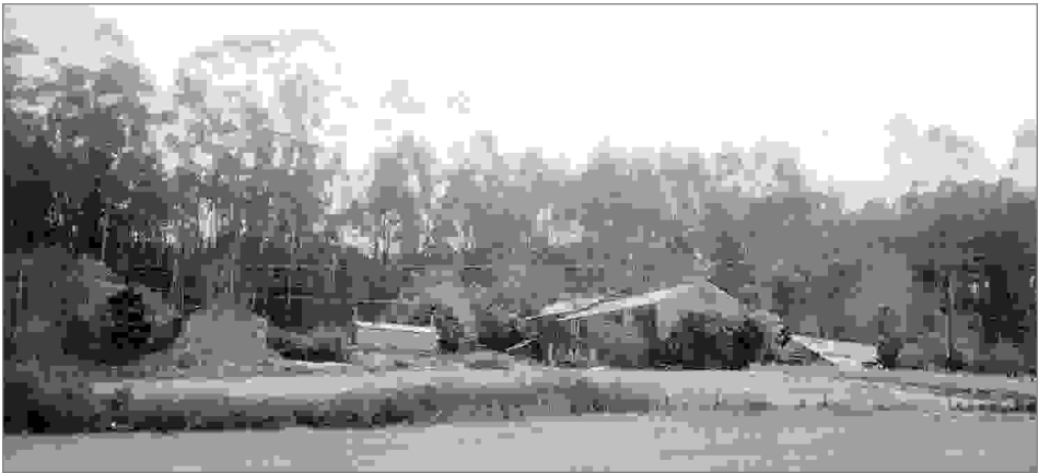
Lugar de Pazos.