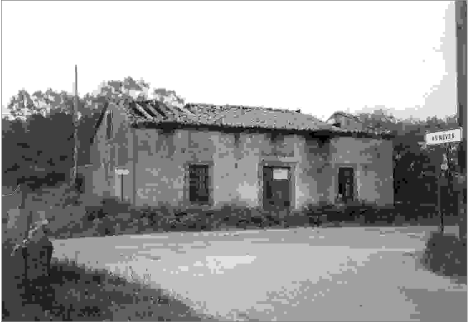
Cuartelillo da Garda Civil en Vilarón, As Neves, Capela.