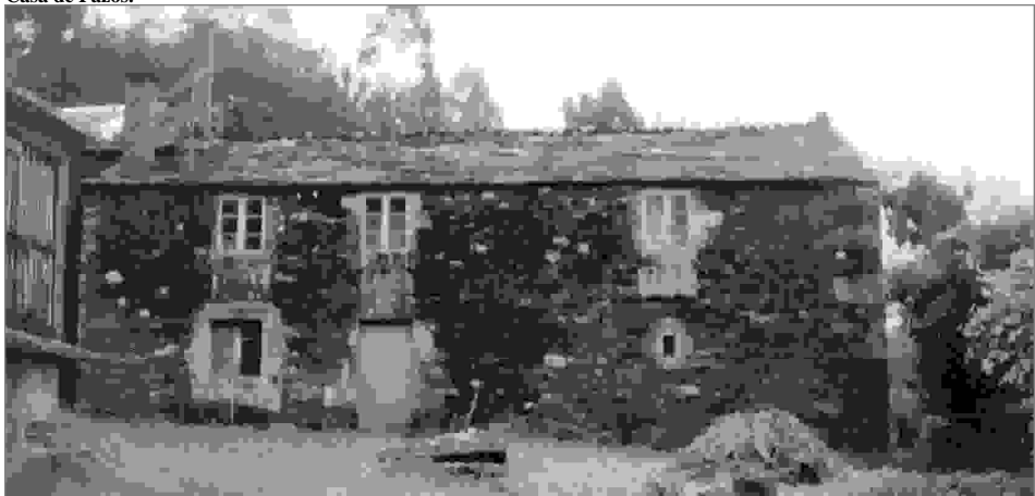
Casa de Pazos.