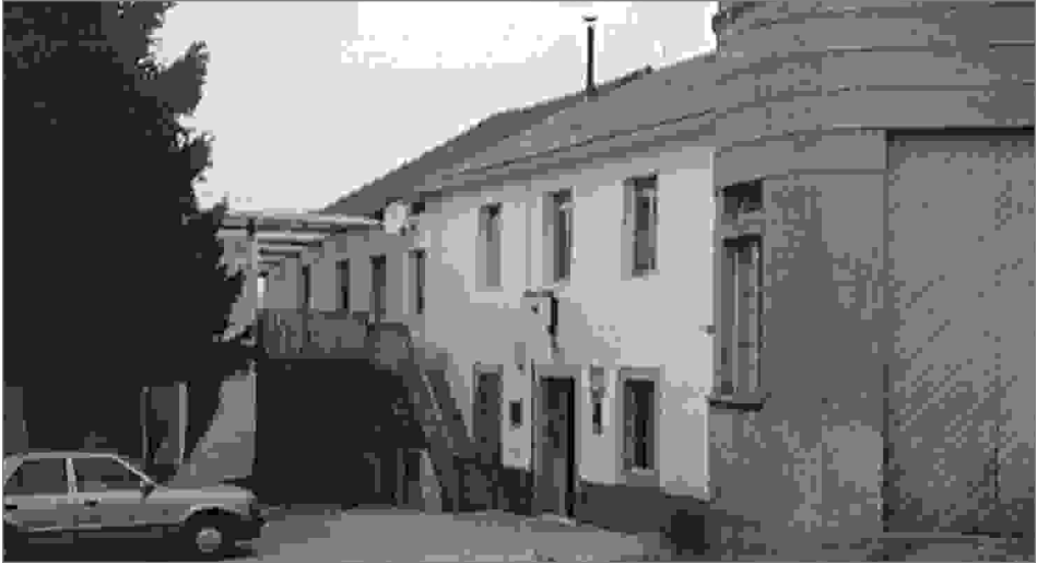
Edificio da antiga farmacia de O Xestal (Monfero).

tancia ó supoñer que a farmacéutica sufrira un desmaio. En realidade, xa estaba morta. Cando todo rematou, os fuxidos marcharon por onde está a fonte nova, en dirección á Graña, pola estrada das Travesas; ían cantando e pegando tiros ó aire. Xa era noite pechada".