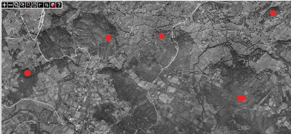
Fotografía aérea da localización dos cinco castros de San Sadurniño (1956)