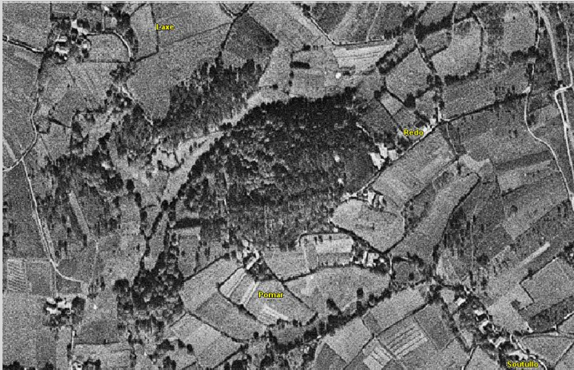
Foto aérea do Castro do Redo en 1956.