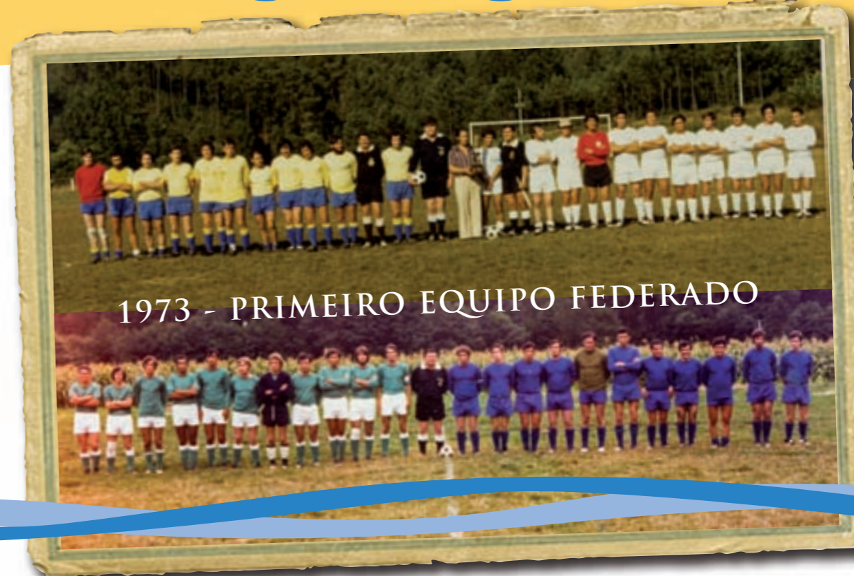
1973 - PRIMEIRO EQUIPO FEDERADO