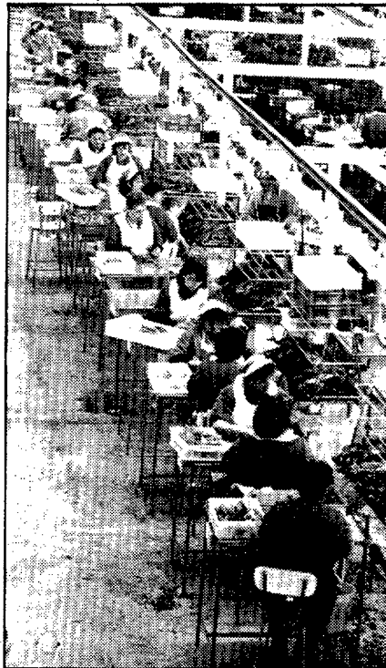
Doscientas personas componen la plantilla fija de la conservera

Conservas y Frío de Algeciras, de esta localidad gaditana, mientras que participa al 50% en Conservas Busto, de Motrico (Vizcaya) y al 33% en Pescados y Mariscos Lojo. Esta sociedad de A Puebla