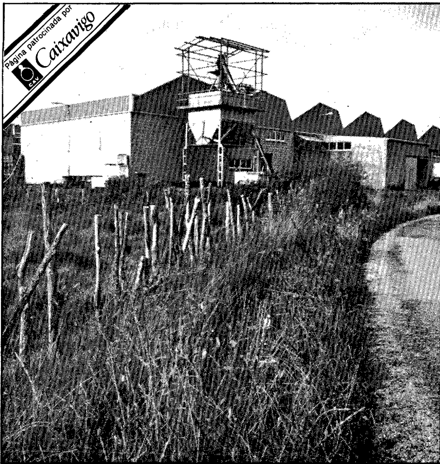
Las fábricas de la compañía —en la fotografía, la de San Sadurniño— tienen su mayor actividad entre octubre y noviembre, cuando reciben la producción de la campaña bonitera

Las factorías que la firma posee en San Sadurniño y O Vicedo transforman al año unas 16.000 toneladas de pescado