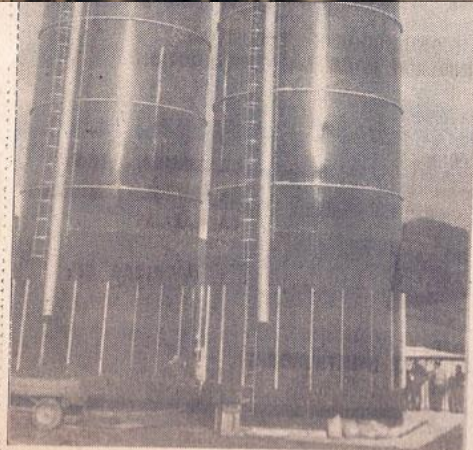
Los dos modernos silos que funcionan en el complejo de la Cooperativa de San Saturnino, tienen una capacidad, cada uno, de 250 toneladas y su coste total rebasa los dos millones de pesetas. La Cooperativa tiene proyectado construir otros dos en las inmediaciones del actual complejo situado en el valle de San Saturnino.

EL FERROL.— San Saturnino, y en él, estoy seguro, tendrá San Saturnino un brillante porvenir. Pioneros de esta transformación que ya obtiene sus primeros frutos después de varios años de des-