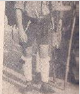
Los Scouts de España patronal en honor a numerosos scouts. En